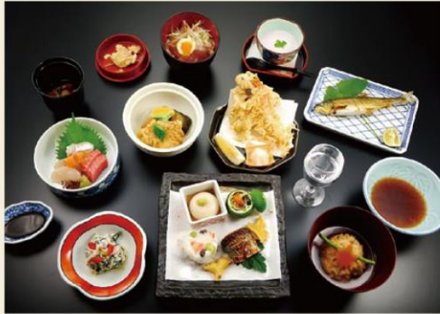
あおい 五千円 先付・八寸・お椀・向付・焼物・煮物 天麩羅・お食事・水菓子