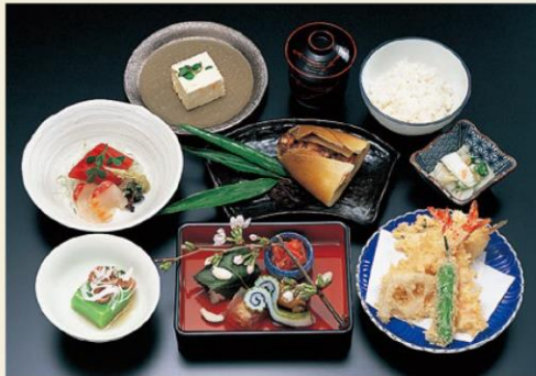
かみなりもん 四千円 先付・八寸・向付・季節の一品 天麩羅・お食事・水菓子