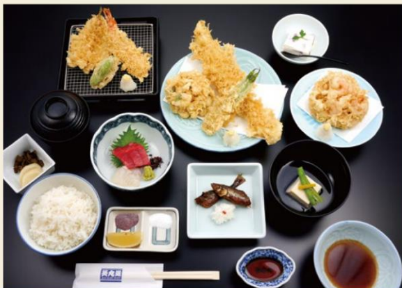
天麩羅コース(松) 五千円 天麩羅中心のコースでございます。

先付・お椀・向付・特選天麩羅盛り合わせ・小海老小かき揚げ・お食事・水菓子 天然天ダネの味をご賞味ください。