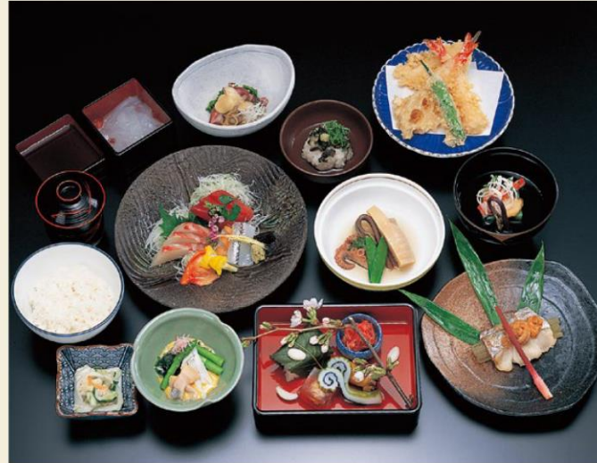
きんりゅう 八千円

先付・お椀・向付・特選天麩羅盛り合わせ・小海老小かき揚げ・お食事・水菓子 天然天ダネの味をご賞味ください。